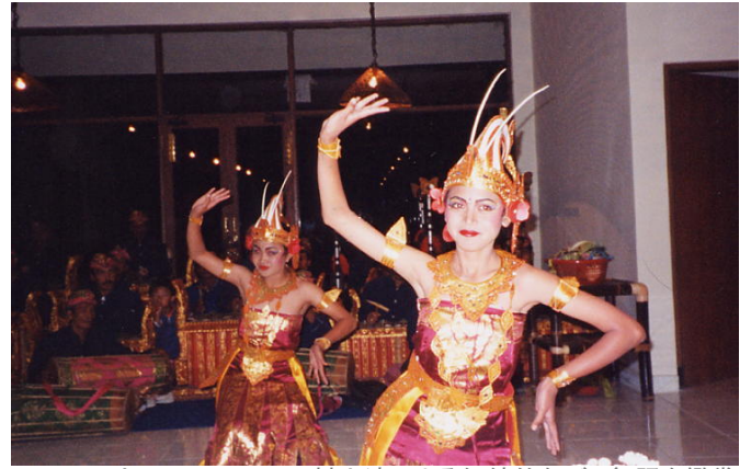
当レストランにて、村人達による伝統的なバリ舞踊を鑑賞

●施設内のセンターハウス。中にはレストラン、ショップ、日本式大風呂などがあります。