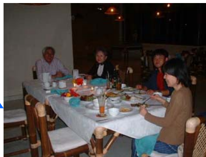
レストランでのお食事風景